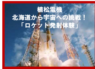
植松電機 北海道から宇宙への挑戦! 「ロケット発射体験」

2019年の長距離サイエンスキャンプは「夏の北海道」で地球をカラダ全体で感じて学びます! 植松電機ロケット発射実験、旭山動物園の日本一の生態展示、アンモナイト化石採集、熱気球、ラフティング... など貴重な体験プログラムが盛りだくさん! 大自然を科学する4泊5日の大冒険がここに始まる!!